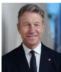
Terje Aasland, Energiminister