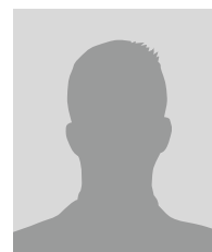
Representant Wintershall Dea